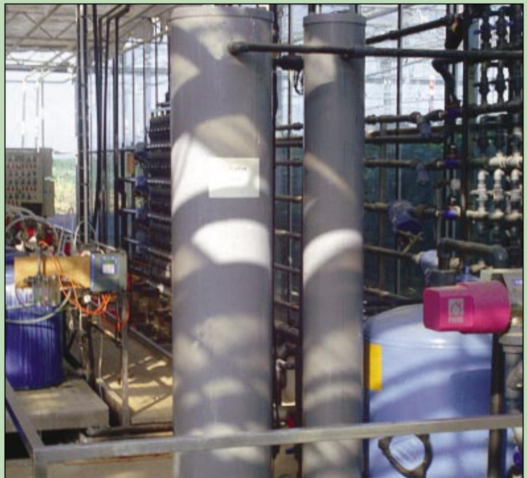
Prototype de désinfection par filtration lente : procédé prometteur

Une serre génère trois catégories de déchets : les déchets verts, les plastiques et les substrats.