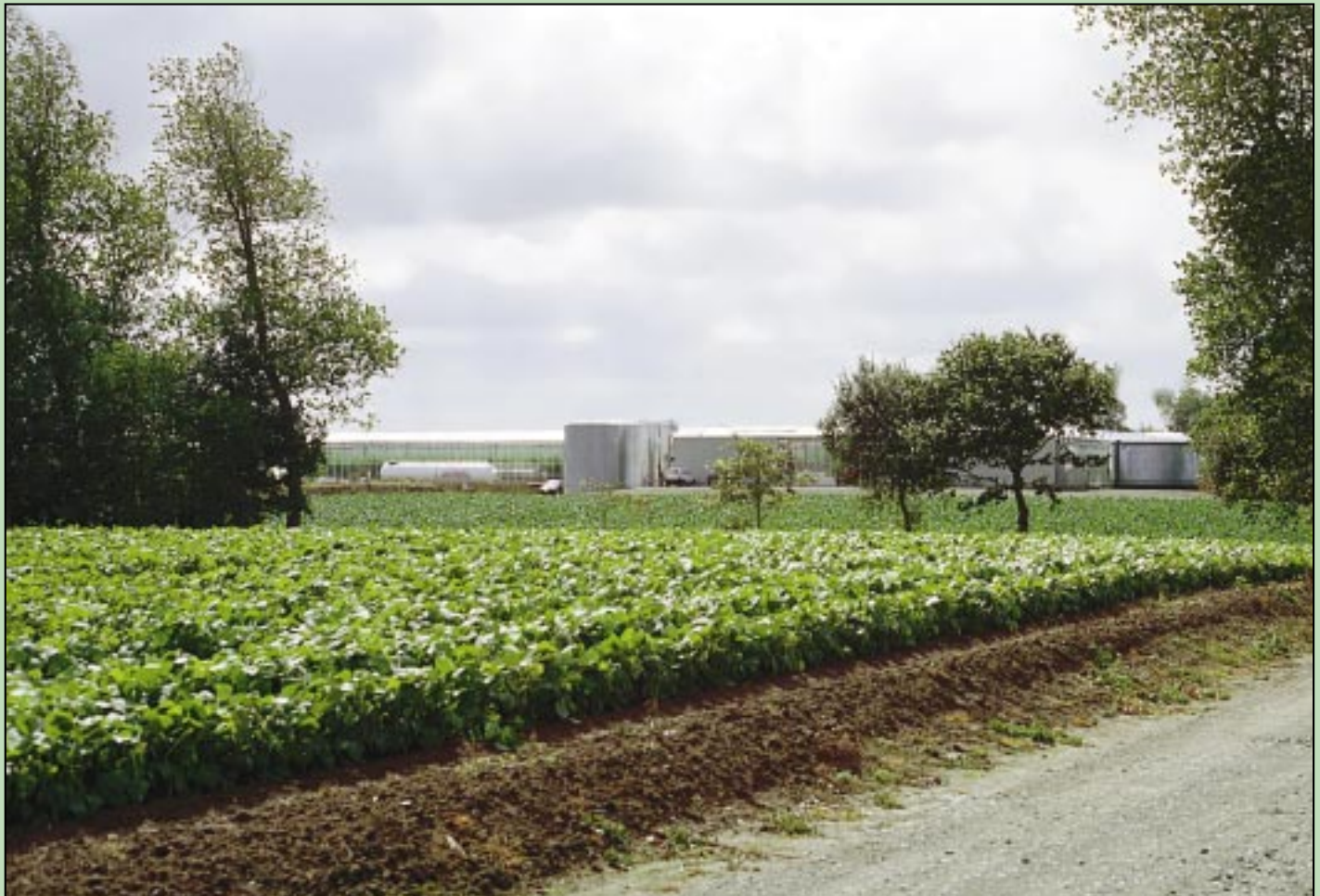
Une serre bien intégrée dans le paysage